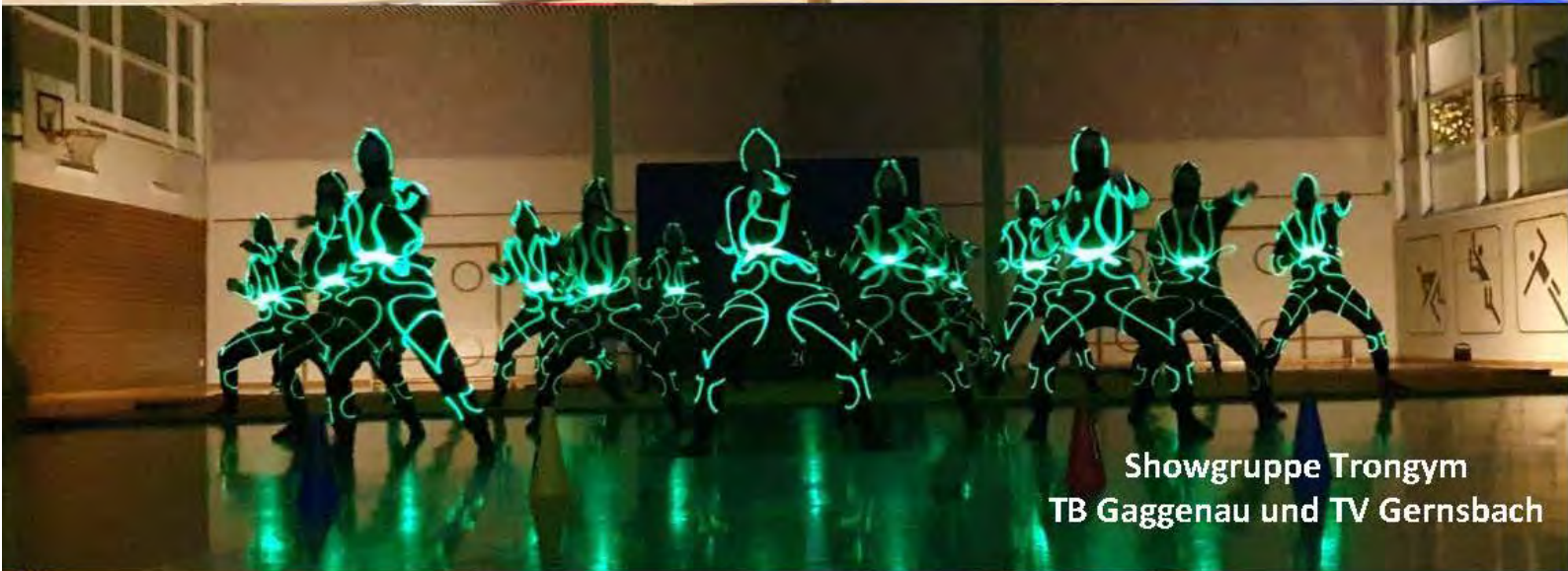
Showgruppe Trongym TB Gaggenau und TV Gernsbach