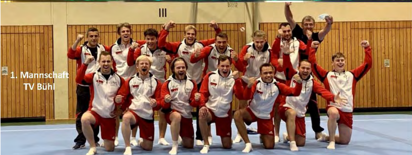
1. Mannschaft TV Bühl